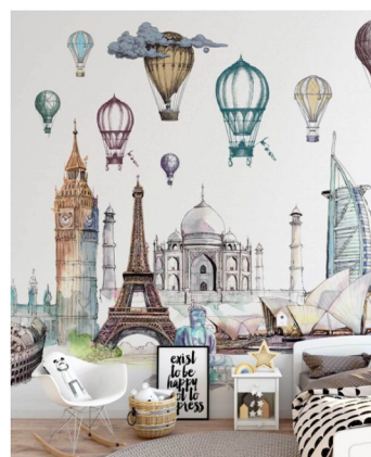
Go To Travel